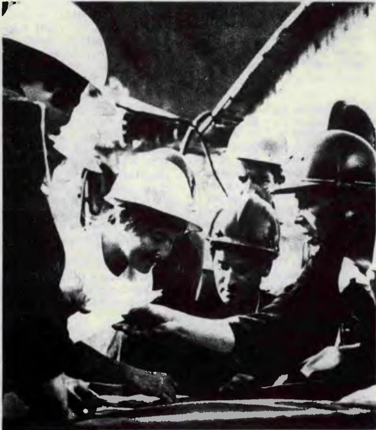
SOVYETLER BİRLİĞİ'NDE HALK, YÖNETİME HER AŞAMADA AKTİF OLARAK KATILIR. ÜLKENİN GELECEĞİ İLE İLGİLİ KARARLAR ALIR, BU KARARLARI UYGULAMAYA KOR.

Her Sovyet vatandaşının, iş bulma garantisi vardır; sağlık servisleri üç-