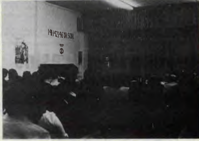
● GENEL KURUL TOPLANTISINDAN BİR GÖRÜNÜS... ●

Genel Kurul, burjuvazinin saldırısına karşı daha yağın sal, daha güçlü bir İTİB için federasyonlaşma kararı aldı. Yeni Tüzük oybirliğiyle, alkışlarla onaylandı. Yeni Genel Yönetim Kurulu oy-